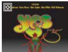
MVDvisual Sin clasificar, en dos discos, 256 minutos, con audio en inglés