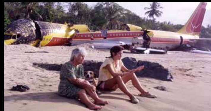
THE LAST ISLAND