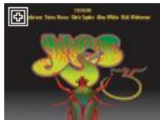
MVDvisual Sin clasificar, en dos discos, 256 minutos, con audio en inglés