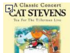
MVDvisual Sin clasificar, 35 minutos, con audio en inglés