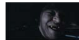
Endnu en vampyr i close-