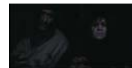
Vampyrerne nærmer sig