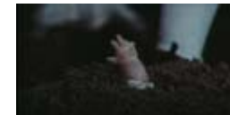
Memento mori-dukken på kirkegården