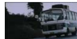
Undervejs i bussen