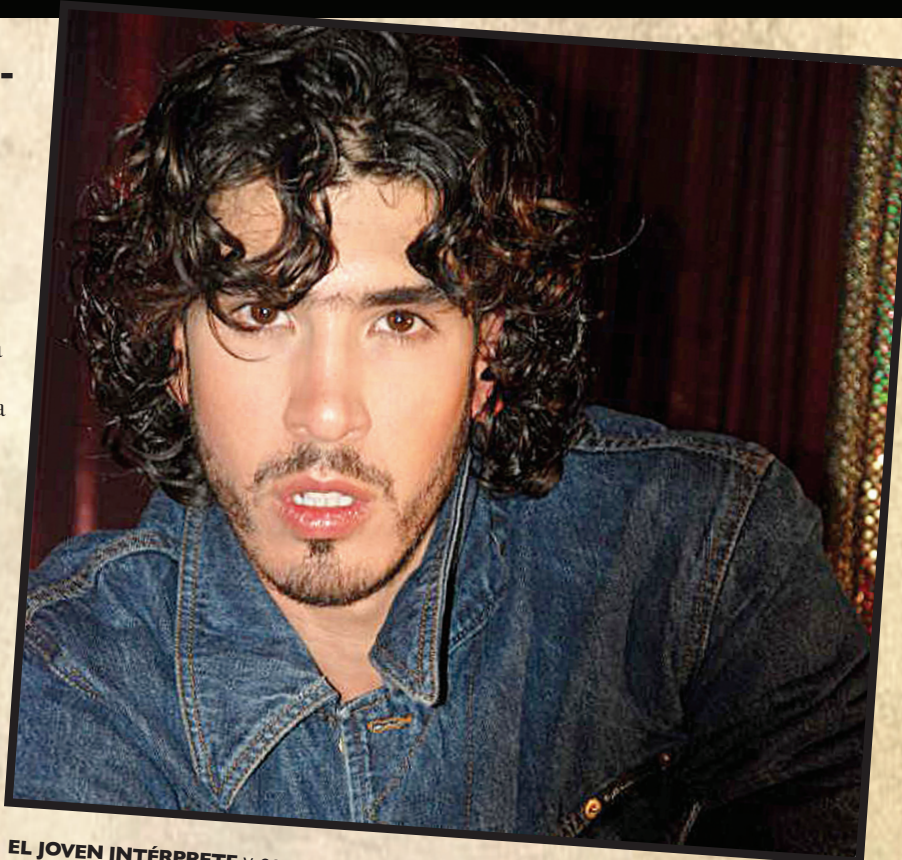
EL JOVEN INTÉRPRETE y compositor eligió a Puerto Rico como su lugar de lanzamiento.

Creo que la diferencia básicamente está en la mezcla de las bandas europeas para darle toque futurista, pero al mismo tiempo con rock,