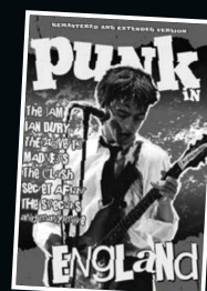
Punk in England The Jam, Ian Dury, Madness, The Clash, The Specials y otros (MVD)