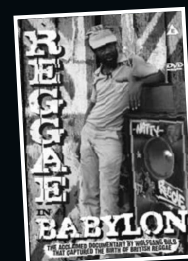
Reggae in a Babylon (MVD)