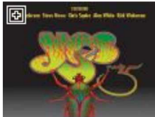
MVDvisual Sin clasificar, en dos discos, 256 minutos, con audio en inglés