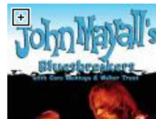
MVDvisual Sin clasificar, 85 minutos, con audio en inglés