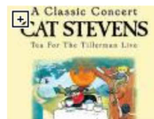
MVDvisual Sin clasificar, 35 minutos, con audio en inglés