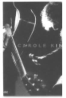
CAROLE KING IN CONCERT

Der Soundtrack wurde für die DVD-Deluxe-Ausgabe in 5.1 Surround Sound und PCM-Stereo von den Mastartapes neu abgemischt. Audio-Kommentare von Roger Waters mit dem Trickvisagisten Gerald Scarfe, ein "Making Of" von 1982 und eine 1999 entstandene Retrospektive mit Neu-Bewertungen von Regisseur Alan Parker, Roger Waters und Gerald Scarfe bieten aufschlussreiche Hintergrund-Infos. Misspunkt: das Fehlen deutscher Untertitel. Die gibt es nur in Englisch, Französisch und Spanisch! (Sony, 160 Min.) 30w