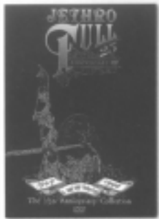
JETHRO TULL A NEW DAY YESTERDAY