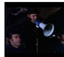
Politichefen (John Saxon)