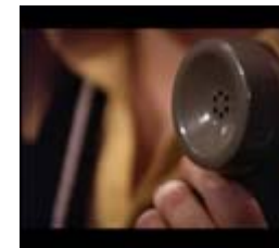
Det centrale terrormiddel

Udover at filmen rent fortællermæssig, filmhistorisk og genremæssigt er vigtig, er Black Christmas stilistisk intet mindre en fremragende. Det skyldes hovedsageligt fotografen Reginald H. Morris og hans sublime måde at bruge det bevægelige kamera på. Fra filmens indledning, hvor vi i en lang POV-sekvens ser morderen ankomme til huset, til filmens slutsekvens, hvor kameraet glider søgende rundt i bygningen.