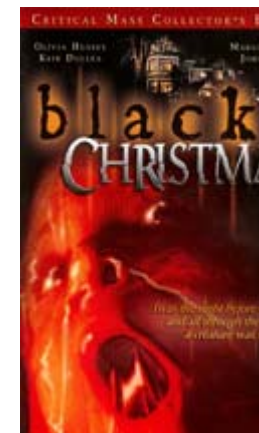
Black Christmas - DVD, region 1

I filmens begyndelse får pigerne et opkald fra en ubehagelig stønner og telefonen forbliver en vigtig drivkraft i historien. For hvem er morderen egentlig og hvem er det der bliver ved med at ringe til huset, samtidig med